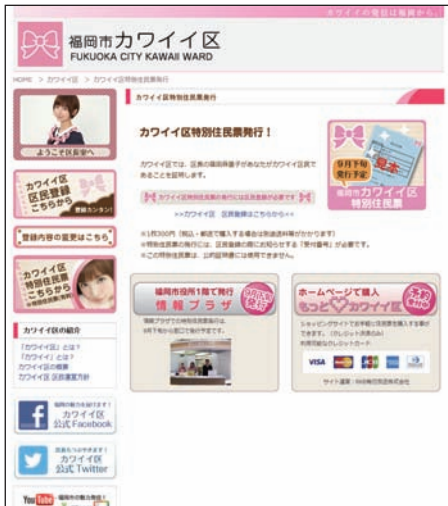
▲福岡市の「カワイイ区」登録ページ。 住民登録は、半日で1万人を突破した。