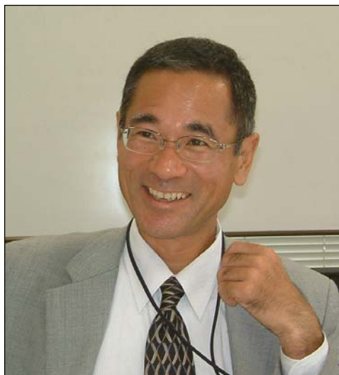
▲今年も中小企業を雇用の側面から支援します