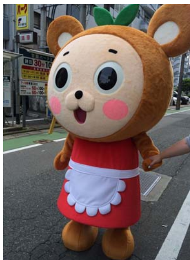
▲街で会ったら声をかけてね☆